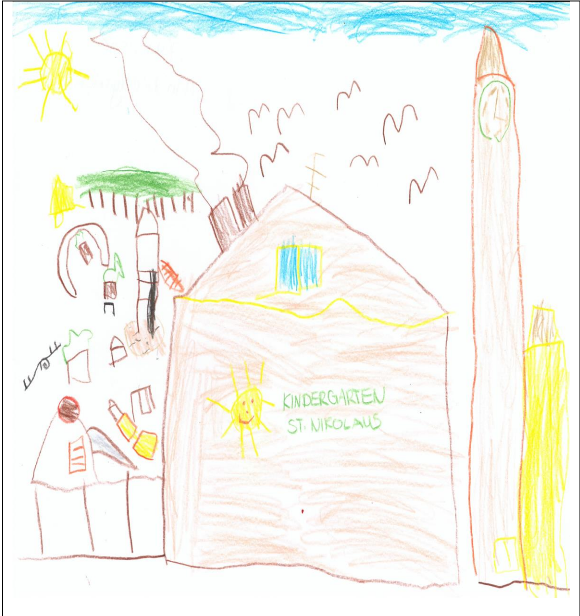
KINDERGARTEN ST. NIKOLAUS, WORBLINGEN