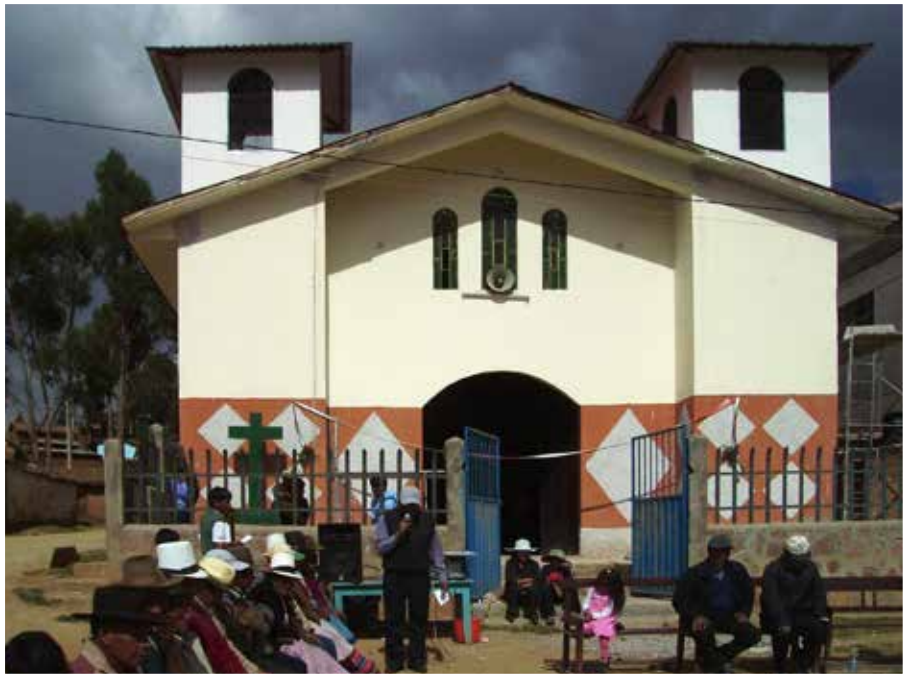
Pfarrkirche in Santa Ana Chacán/Peru